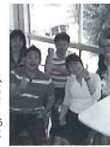
ユースポート横濱 講師陣

特定非営利活動法人ユースポート横濱 理事長 千葉大学特殊教育特別専攻科修了。 2002年4月よりひきこもり支援団体「ユースサポートネット・リロード」事務局長に就任。その後、ひきこもり経験のある若者が就業の課題に直面したことをきっかけに2006年7月「ヤングジョブス・ポットよこはま」に関わり、2006年9月「ユースポート横濱」設立に参画し、理事長に就任。「市民で創るヨコハマ若者応援特区実行委員会」代表として、「若者と社会をつなげる」ために日々奔走している。